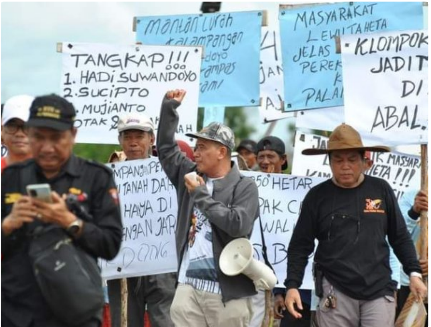
Gambar: Aksi Unjuk Rasa Masyarakat Kelompok Tani

PALANGKA RAYA - Sengketa kepemilikan tanah yang terjadi di Kota Palangka Raya selama ini, cukup meresahkan. Hal ini tentunya bisa mempengaruhi geliat pembangunan di ibukota provinsi Kalimantan Tengah (Kalteng) kedepannya.